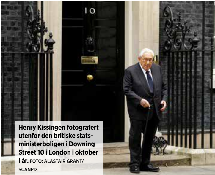
Henry Kissingen fotografert utenfor den britiske statsministerboligen i Downing Street 10 i London i oktober i år.